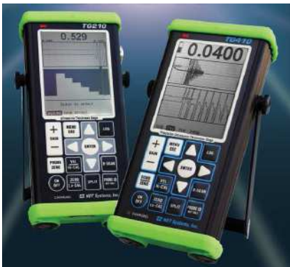
TG210 & TG410

当社では、当該製品を含めた高性能機器を始め、簡易な厚さ計まで幅広く製品を取り揃えております。